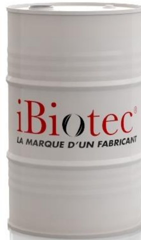
200 L 케그