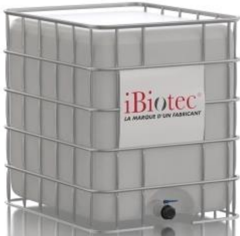
GRV 1000 L 컨테이너